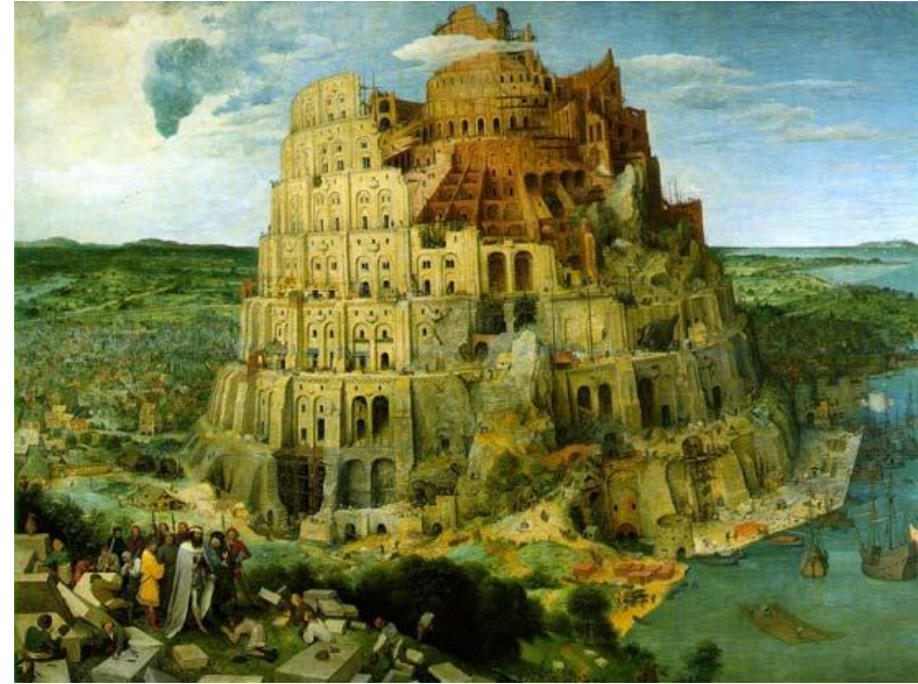
La tour de Babel

"Si un aveugle guide un aveugle, tous les deux tomberont dans un trou"