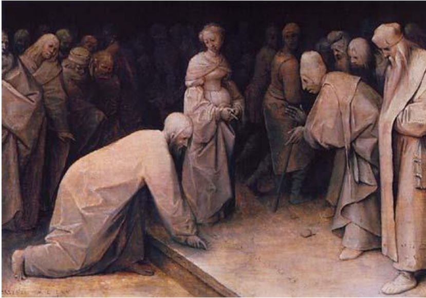
Le Christ et la femme adultère

Bruegel place au milieu du tableau une femme gracieuse qui est accusée d'adultère par les Pharisiens. Elle constitue l'un des rares personnages féminins que Bruegel a représentés non pas en campagnarde attachée à sa terre mais suivant l'idéal de beauté des citadins.