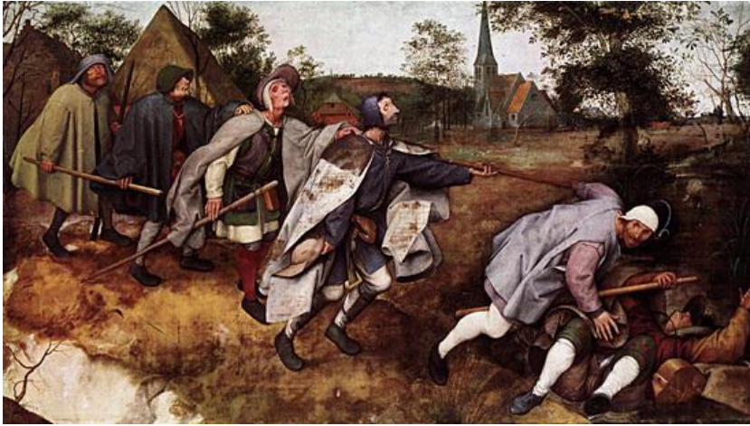
La parabole des aveugles

"Si un aveugle guide un aveugle, tous les deux tomberont dans un trou"