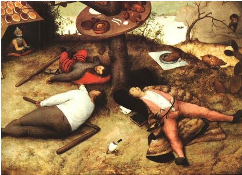
Le Pays de cocagne

Un paysan, un chevalier et un clerc reposent le ventre plein sous un arbre qui porte une table dressée. L'écuyer en partie vêtu d'une armure monte la garde et espère que quelque-chose lui tombera "dans le bec". Derrière la fantaisie d'un pays légendaire où la nourriture est en abondance, il y a la douloureuse expérience des famines chroniques