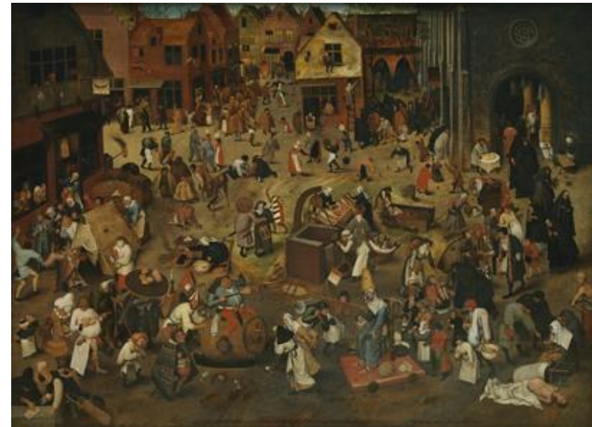
Le Combat de carnaval et carême

Obèse, le prince Carnaval est censé représenter les protestants, l'individu maigre et triste, affublé d'une ruche sur la tête, incarne lui les catholiques. Bruegel les caricature autant l'un que l'autre. Au centre de la composition, un bouffon guide de nouveau deux personnes. Il a allumé son flambeau bien qu'il fasse encore jour : c'est le signe d'un monde renversé.